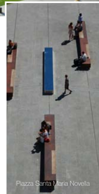
Piazza Santa Maria Novella

Record of foreign delegations, this year at CarraraMarmotec, from 19 to 22 May. Actually, more than five hundreds architects and operators will be officially present as groups and delegations: a number never recorded before at the fair. As regards the visitors, the overall picture includes eleven groups, for each of which a programme of visits will be drawn up, planned according to their specific needs and requirements. The events and meetings have been organised jointly by CarraraFiere along with the Italian Institute for Foreign Trade (ICE), the Tuscan Regional Government, Lucca Chamber of Commerce and Lucca Promos, with particular attention to the selection of delegates. If architects, they represent important offices, while if industry players, they represent quality companies. Hence, not only quantity, but also quality of the foreign delegation and company, for a very ambitious fair.